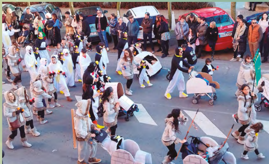
CEIP SANTA MARTA