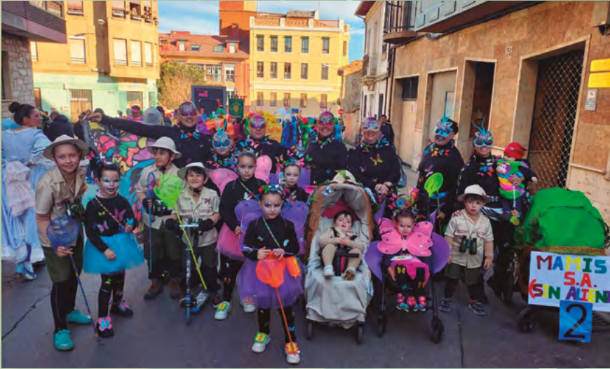
MAMIS S. A.